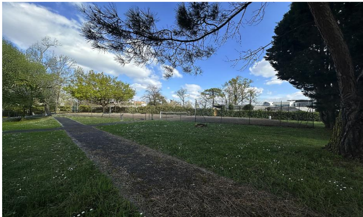
Photo de l'état actuel du terrain de sport

Le projet consiste à construire un terrain de padel sur un terrain de sport existant. Ce terrain de padel sera abrité d'une structure métallique en aluminium couvert par une toile blanche.