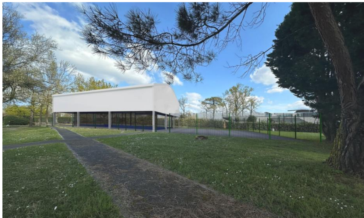
Image de projection du projet